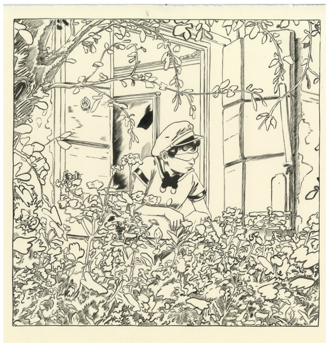
Ugo Bienvenu, Futur antérieur , 26 x 26 cm, encre de Chine sur papier ©Ugo Bienvenu / courtesy Galerie Martel