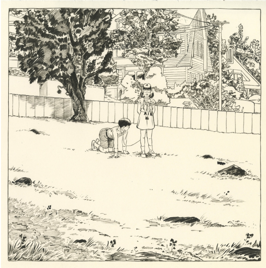
Ugo Bienvenu, Futur antérieur , 26 x 26 cm, China ink on paper ©Ugo Bienvenu / courtesy Galerie Martel