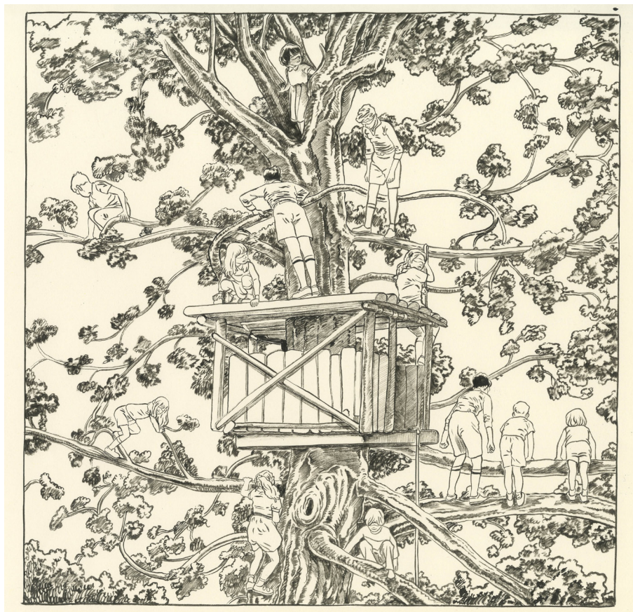
Ugo Bienvenu, Futur antérieur , 26 x 26 cm, China ink on paper ©Ugo Bienvenu / courtesy Galerie Martel