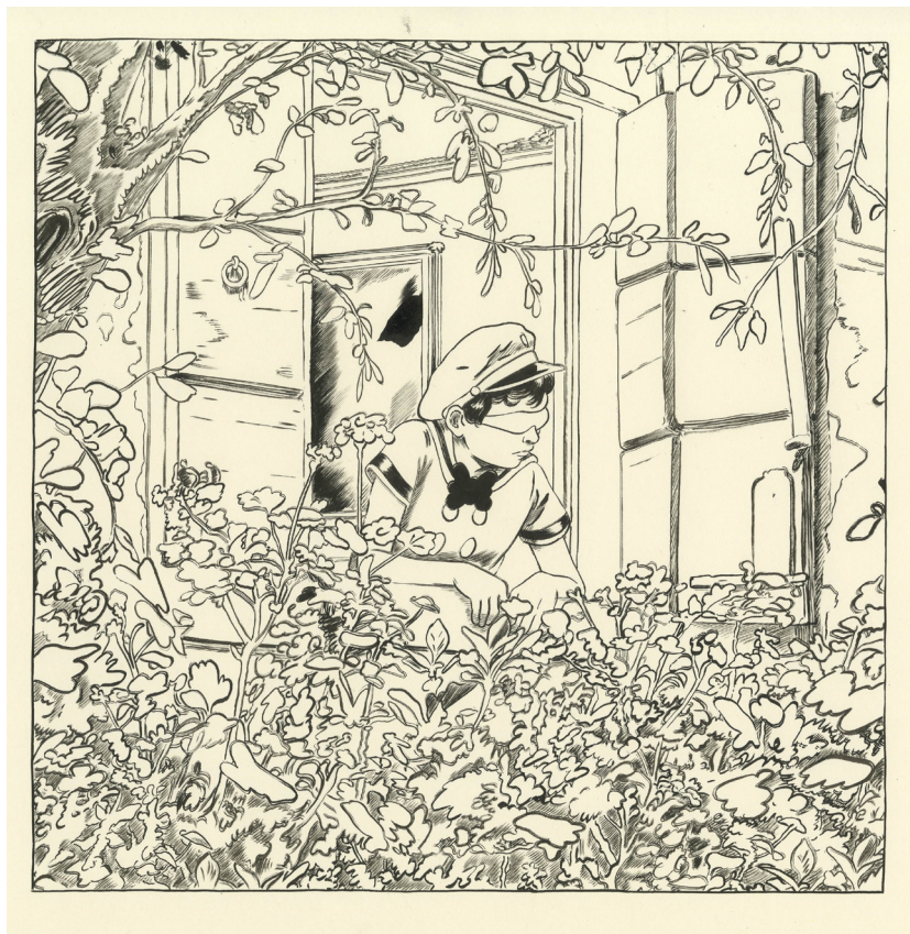
Ugo Bienvenu, Futur antérieur , 26 x 26 cm, China ink on paper ©Ugo Bienvenu / courtesy Galerie Martel